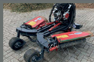
Vimas Eco cleaner draadmaaier voor mechanische onkruidbestrijding