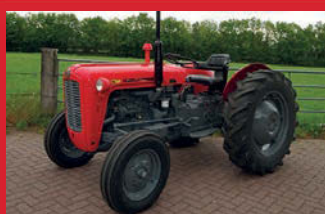
Massey Ferguson 35x, met 3 cil. dieselmotor, 2wd, 42 pk, gespoten & technisch klaargemaakt