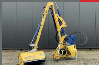
Marolin M380 maaiaarm z.g.a.n. met 80 cm klepelbak