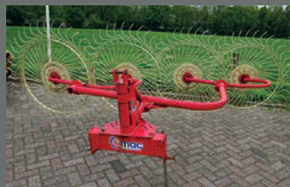
Qmac 4-bords acrobaat zo goed als nieuw