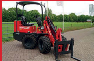
Thaler 2034/KA minishovel, incl. bak en palletlepels en klaargemaakt