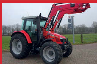
Massey Ferguson 5450 met Trima voorlader 4wd, 105 pk, Dyna-4 transmissie