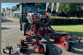
Ladurner 7FS rijenfrees voor mechanische onkruidbestrijding