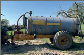
Veenhuis 6800 tank voor mest of water