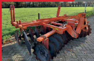
Fieldking Tandem Harrow 2,60m. schijveneg, 55 cm Ø schijven