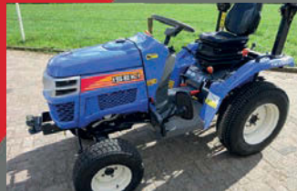
Iseki TM3160F compact tractor z.g.a.n. én Iseki Sial 16S Hunter compact tractor