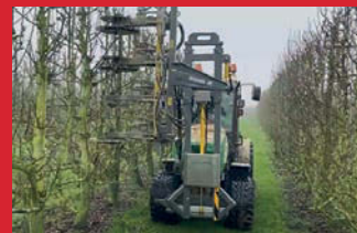
Grunner Grizzly venstersnoeimachine om o.a. fruitbomen lucht en licht te geven